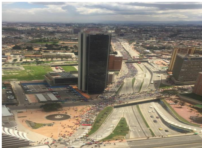
Foto: Paro Nal FECODE Mayo 16 de 2017 Toma de Bogotá