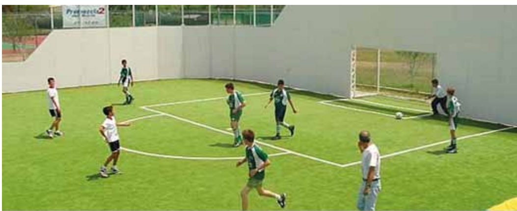
Imagen 3. Sugerencia ubicación de la cámara en exteriores