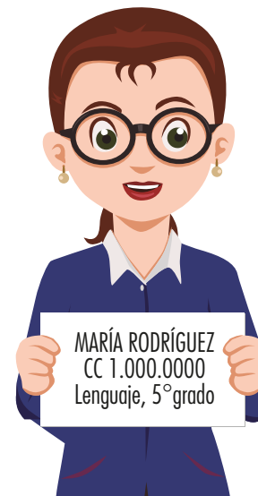
Imagen 4. Ejemplo de hoja con datos