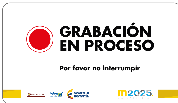
Imagen 1. Ejemplo de aviso de grabación en proceso